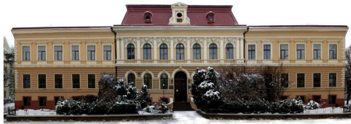
Окремий корпус юридичного факультету Чернівецького університету було збудовано майже через 10 років після його заснування. У 301-303 аудиторіях даного корпусу і розташовується кафедра